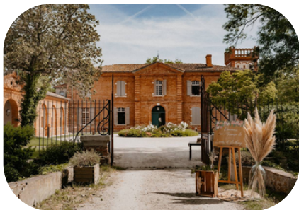
L'Orangerie des Demoiselles Toulouse

Parce que le cadre est aussi important que le contenu, nous portons une attention toute particulière au choix de nos lieux de formation . En voici quelques exemples: