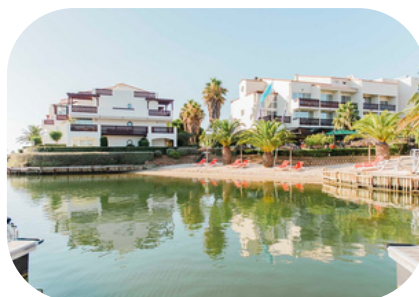
Ile de la Lagune St Cyprien