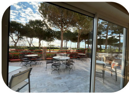
Grand Hôtel du Lido Argelès-sur-Mer