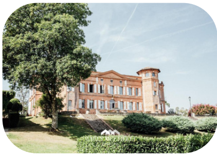
Château Loubéjac Montauban