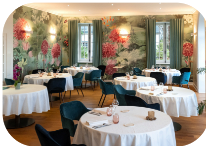
Domaine Mont Riant Pau