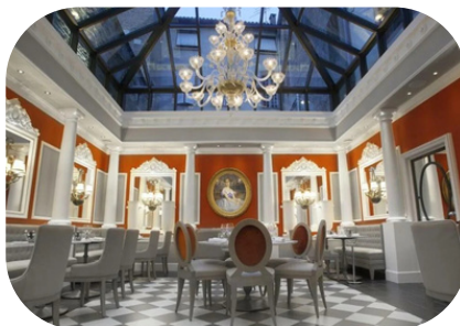
Hôtel Alchimy Albi