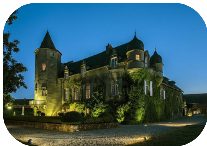
Château Labro Rodez