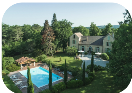
Domaine Le Castelet Castres