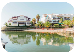
Ile de la Lagune St Cyprien