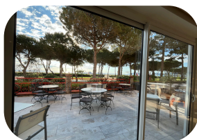
Grand Hôtel du Lido Argelès-sur-Mer