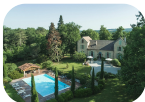
Domaine Le Castelet Castres