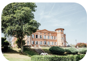
Château Loubéjac Montauban